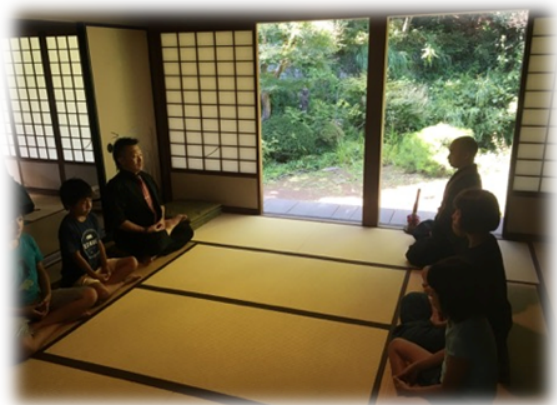
講座の前半は坐禅に取り組み、心を落ち着けます。